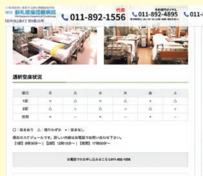
病院ホームページ